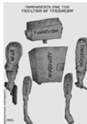
आतंकवाद के जन्म के कारण

संयुक्त राष्ट्र शैक्षणिक, वैज्ञानिक एवं सांस्कृतिक संगठन (यूनिसेफ) के संविधान ने उचित ही टिप्पणी की है कि, “चूँकि युद्ध का आरंभ