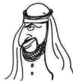
शेख पैट्रो डॉलर-उल्ला काला सोना मुल्क के सुल्तान

बेशकीमती चीज़ों की मैं कद्र करता हूँ। बिग ऑयल कहते हैं कि उनके राष्ट्रपति आज़ादी और जम्हूरियत को बड़ा कीमती मानते हैं इसीलिए मैंने भी अपने मुल्क में आज़ादी और जम्हूरियत को सात तालों के भीतर बंद करके रखा है।