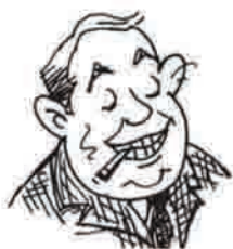
जनाब बिग ऑयल बिग ऑयल एंड संस के सीईओ

एक दिन मैंने खुद से पूछा कि आखिर मैं अपने मुल्क के किस काम आ सकता हूँ। मेरे मुल्क में तेल की भूख विकट है। वह कभी खत्म होने का नाम नहीं लेती, चलो, तो फिर तेल का इंतज़ाम करते हैं। मैं बाज़ार की आज़ादी का हामी हूँ। मतलब यह कि दूर के देशों में तेल के कुएँ खोदने की आज़ादी; धरती की आबो-हवा को मटियामेंट करने की आज़ादी और ऐसे कठपुतले तानाशाहों की ताजपोशी की आज़ादी जो अपनी ही जनता पर कोड़े फटकारे।