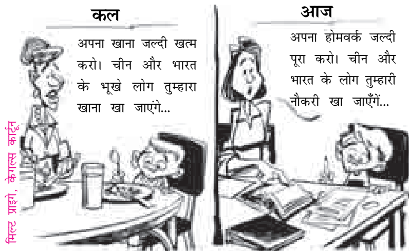
वैश्वीकरण के खतरे?

अमूमन जिस प्रक्रिया को आर्थिक वैश्वीकरण कहा जाता है उसमें दुनिया के विभिन्न देशों के बीच आर्थिक प्रवाह तेज हो जाता है। कुछ आर्थिक प्रवाह स्वेच्छा से होते हैं जबकि कुछ अंतर्राष्ट्रीय संस्थाओं और ताकतवर देशों द्वारा जबरन लादे जाते हैं। जैसा कि हमने इस अध्याय की शुरुआत में देखा, ये प्रवाह कई किस्म के हो सकते हैं, जैसे वस्तुओं, पूंजी, जनता अथवा विचारों का प्रवाह। वैश्वीकरण के चलते पूरी दुनिया में वस्तुओं के व्यापार में इजाफा हुआ है;