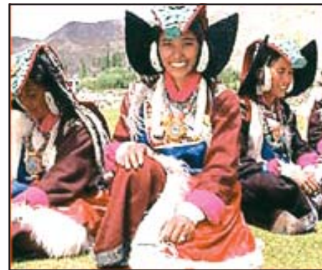
चित्र 10.6 : पारंपरिक वेशभूषा में लद्दाखी महिलाएँ

आधुनिकीकरण के फलस्वरूप यहाँ के जनजीवन में परिवर्तन आ रहा है। लेकिन लद्दाख के लोगों ने शताब्दियों से प्रकृति के साथ समन्वय एवं संतुलन करना सीखा है। जल एवं ईंधन जैसे संसाधनों की कमी के कारण ये आवश्यकतानुसार एवं मितव्ययिता से ही इनका उपयोग करते हैं और कुछ भी व्यर्थ नहीं करते।