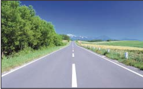
चित्र 7.6 : पक्की सड़क

कम दूरी यातायात के सबसे अधिक उपयोग किए जाने वाले मार्ग सड़क हैं। सड़कें पक्की एवं कच्ची हो सकती हैं (चित्र 7.6 एवं 7.7)। मैदानी क्षेत्रों में सड़कों का घना जाल बिछा है। मरुस्थलों, वनों एवं ऊँचे पर्वत जैसे स्थानों पर भी सड़कें बनी हुई हैं। हिमालय पर्वत पर मनाली-लेह राजमार्ग विश्व के सबसे ऊँचे सड़क मार्गों में से एक है। भूमिगत सड़कों को भूमिगत मार्ग (सब वे) कहते हैं। फ्लाईओवर, उत्थित संरचनाओं के ऊपर बनाए जाते हैं।