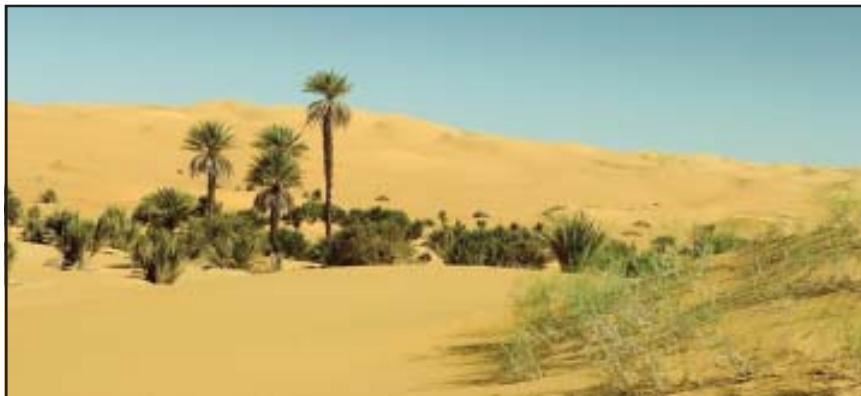
चित्र 10.3 : सहारा रेगिस्तान में मरूद्यान

ऊँट, लकड़बग्घा, सियार, लोमड़ी, बिच्छू, साँपों की विभिन्न जातियाँ एवं छिपकलियाँ यहाँ के प्रमुख जीव-जंतु हैं।