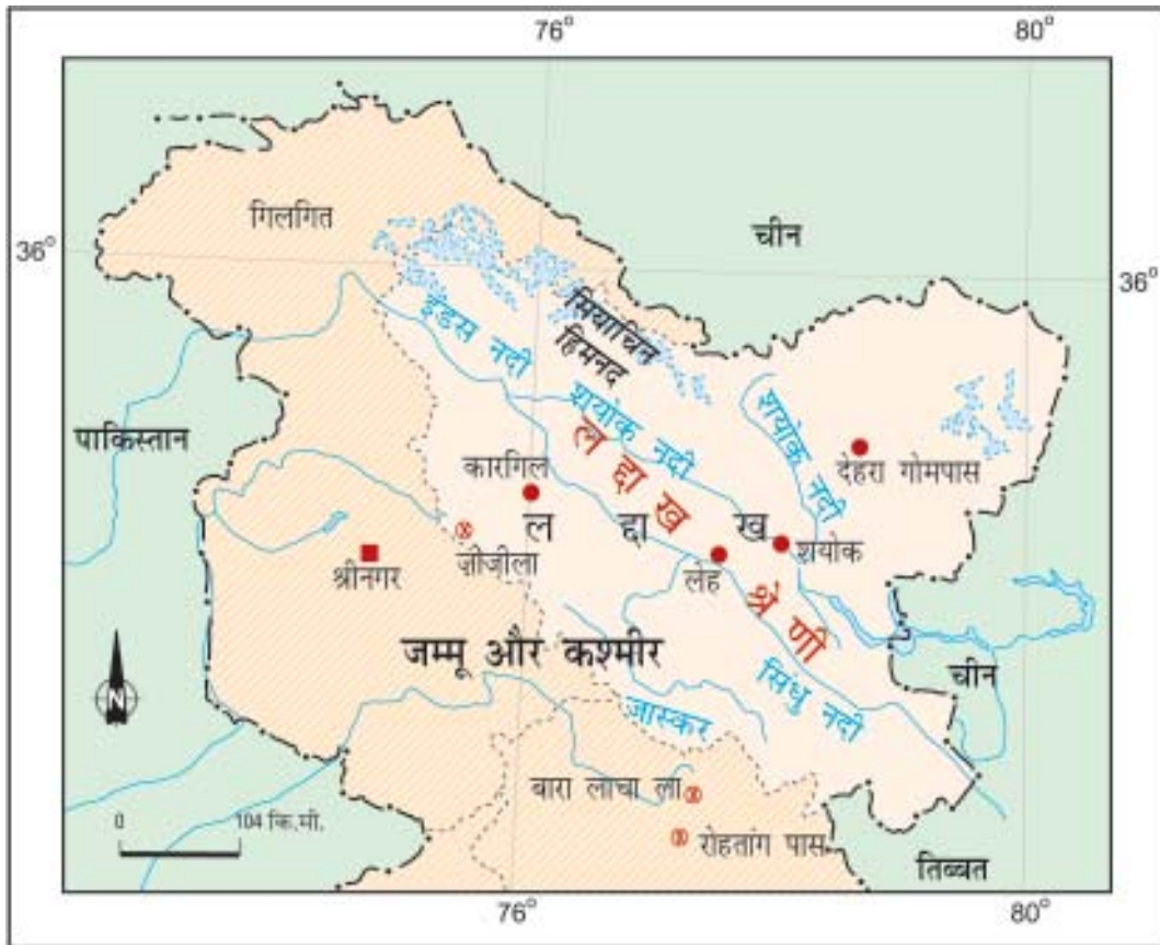
चित्र 10.4 : लद्दाख

लद्दाख की ऊँचाई कारगिल में लगभग 3000 मीटर से लेकर काराकोरम में 8000 मीटर से भी अधिक पाई जाती है। अधिक ऊँचाई के कारण यहाँ की जलवायु अत्यधिक शीतल एवं शुष्क होती है। इस ऊँचाई पर वायु परत पतली होती है जिससे सूर्य की गर्मी की अत्यधिक तीव्रता महसूस होती है। ग्रीष्म ऋतु में दिन का तापमान 0 सेल्सियस से कुछ ही अधिक होता है एवं रात में तापमान शून्य से-30 सेल्सियस से नीचे चला जाता है। शीत ऋतु में यह बर्फ़ीला ठंडा हो जाता है, तापमान लगभग हर समय-40 सेल्सियस से नीचे ही रहता है। चूँकि यह हिमालय के वृष्टि-छाया क्षेत्र में स्थित है, अतः यहाँ वर्षा बहुत ही कम होती