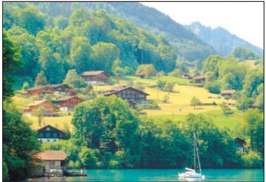
चित्र 7.1 : मानव बस्ती