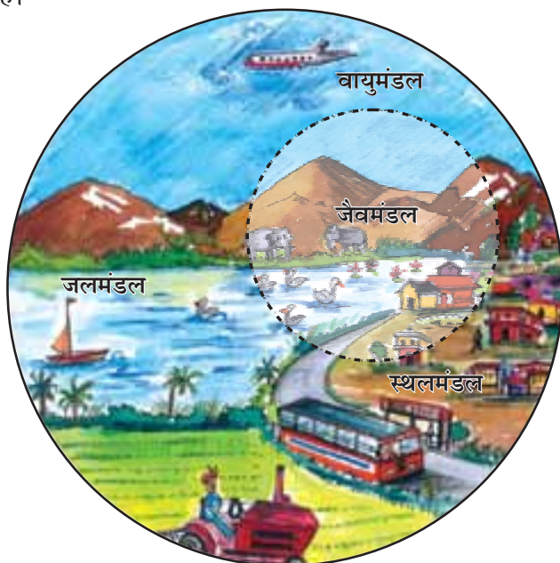
चित्र 1.2 : पर्यावरण के क्षेत्र

स्थलमंडल वह क्षेत्र है, जो हमें वन, कृषि एवं मानव बस्तियों के लिए भूमि, पशुओं को चरने के लिए घासस्थल प्रदान करता है। यह खनिज संपदा का भी एक स्रोत है।