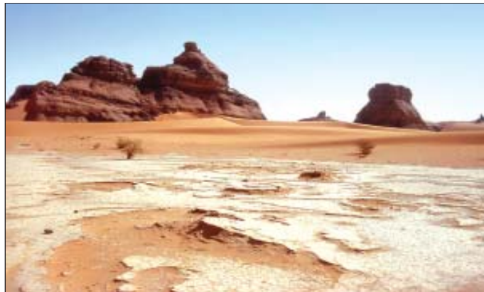
चित्र 10.1 : सहारा रेगिस्तान

रेगिस्तान के बारे में सोचते समय आपके मस्तिष्क में तुरंत ही रेत का दृश्य उभरता है। परंतु सहारा मरुस्थल बालू की विशाल परतों से ढँका हुआ ही नहीं वरन् वहाँ बजरी के मैदान और नग्न चट्टानी सतह वाले उत्थित पठार भी पाए जाते हैं। ये चट्टानी सतहें कुछ स्थानों पर 2500 मीटर से भी अधिक ऊँची हैं।