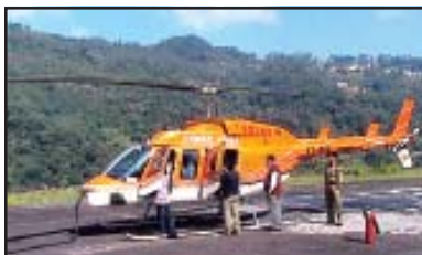
चित्र 7.9 : हेलीकॉप्टर

बीसवीं सदी के आरंभ में विकसित यह परिवहन का सबसे तीव्र मार्ग है। ईंधन की लागत अधिक होने के कारण यह सर्वाधिक महंगा साधन है। वायु यातायात खराब मौसम, जैसे-कुहरे एवं तूफान से कुप्रभावित होता है। यह यातायात का अकेला साधन है, जो सर्वाधिक दुर्गम एवं दुरूह स्थानों तक पहुँच सकता है, विशेष रूप से जहाँ सड़क एवं रेलमार्ग नहीं हैं। हेलीकॉप्टर अगम्य स्थानों एवं संकटकालीन स्थितियों में लोगों को बचाने एवं भोजन, जल, कपड़े एवं दवाएँ बाँटने के लिए एक बहुत ही उपयोगी साधन है (चित्र 7.9)। कुछ महत्वपूर्ण हवाई पत्तन हैं : दिल्ली, मुंबई, न्यूयॉर्क, लंदन, पेरिस, फ्रैंकफर्ट एवं काहिरा (चित्र 7.11)।