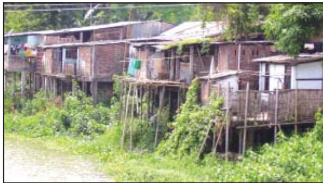
चित्र 7.4 : स्टिल्ट पर मकान

नगरीय बस्तियों में नगर छोटी एवं शहर उनसे बड़ी बस्तियाँ होती हैं। नगरीय क्षेत्रों में लोग निर्माण, व्यापार एवं सेवा क्षेत्रों में कार्यरत होते हैं। अपने राज्य के कुछ गाँवों, नगरों एवं शहरों के नाम लिखिए।