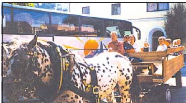
चित्र 7.5 : यातायात के साधन के रूप में घोड़ागाड़ी

परिवहन लोगों एवं सामान के आवागमन के साधन होते हैं। पुराने समय में अधिक दूरी की यात्रा करने में अत्यधिक समय लगता था। उस समय लोग पैदल चलते थे एवं अपने सामान को ढोने के लिए पशुओं का उपयोग करते थे। पहिए की खोज से परिवहन आसान हो गया। समय के साथ परिवहन के विभिन्न साधनों का विकास होता गया, लेकिन आज भी लोग परिवहन के लिए पशुओं का उपयोग करते हैं (चित्र 7.5)।