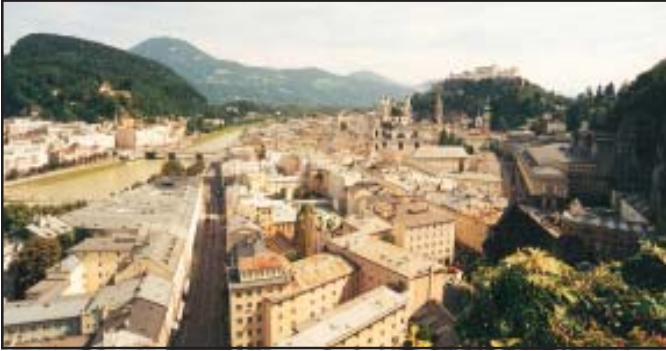
चित्र 7.2 : सघन बस्ती

अस्पताल नहीं हैं, लेकिन हमारे यहाँ बहुत सारी खुली भूमि एवं साँस लेने के लिए ताज़ी हवा मिलती है। जब मेरे दादा जी बीमार थे, तो उनको शहर के अस्पताल में लाना पड़ा था।”