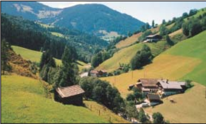
चित्र 7.3 : प्रकीर्ण बस्ती

ऊपर दिए गए संवाद से बस्तियों के दो विभिन्न चित्रण हमारे सामने आते हैं— ग्रामीण एवं शहरी बस्तियाँ। गाँव, ग्रामीण बस्ती होती है; जहाँ लोग कृषि, मत्स्य पालन, वानिकी, दस्तकारी एवं पशुपालन संबंधी कार्य करते हैं। ग्रामीण बस्ती सघन या प्रकीर्ण हो सकती है। सघन बस्तियों में घर पास-पास बने होते हैं (चित्र 7.2)। प्रकीर्ण बस्तियों में लोगों के घर दूर-दूर व्यापक क्षेत्र में फैले होते हैं। इस प्रकार की बस्तियाँ मुख्यतः पहाड़ी क्षेत्रों, घने जंगल एवं अतिविषम जलवायु वाले क्षेत्रों में पाई जाती हैं (चित्र 7.3)।