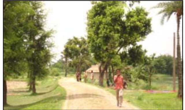
चित्र 7.7 : कच्ची सड़क