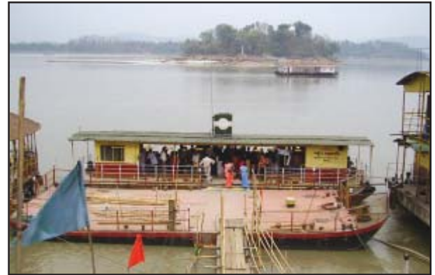
चित्र 7.8 : अंतर्देशीय जलमार्ग

समुद्री एवं महासागरीय मार्गों का उपयोग सामान्यतः व्यापारिक माल एवं समान को एक देश से दूसरे देश में पहुँचाने के लिए करते हैं। ये मार्ग पत्तनों से जुड़े होते हैं। विश्व के कुछ महत्वपूर्ण पत्तन हैं—एशिया में सिंगापुर एवं मुंबई, उत्तर अमेरिका में न्यूयॉर्क एवं लॉस एंजिल्स, दक्षिण अमेरिका में रियो डि जेनेरियो, अफ्रीका में डरबन एवं केपटाउन, आस्ट्रेलिया में सिडनी, यूरोप में लंदन (चित्र 7.11)। क्या आप विश्व के कुछ और पत्तनों के भी नाम बता सकते हैं?