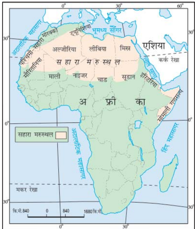
चित्र 10.2 : अफ्रीका महाद्वीप में सहारा

आपको यह जानकर आश्चर्य होगा कि आज का सहारा रेगिस्तान एक समय में पूर्णतया हरा-भरा मैदान था। सहारा की गुफ़ाओं से प्राप्त चित्रों से ज्ञात होता है कि यहाँ नदियाँ तथा मगर पाए जाते थे। हाथी, शेर, जिराफ़, शतुरमुर्ग, भेड़, पशु तथा बकरियाँ सामान्य जानवर थे। परंतु यहाँ के जलवायु परिवर्तन ने इसे बहुत गर्म व शुष्क प्रदेश में बदल दिया है।