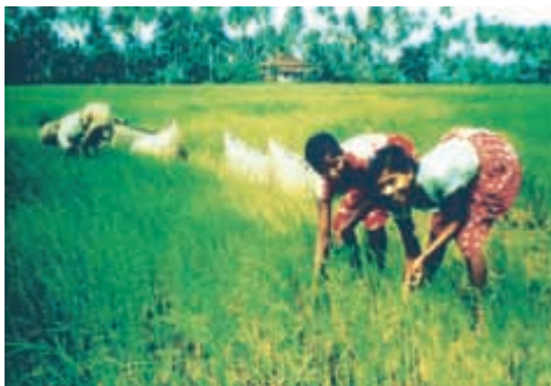
चित्र 2.10 : तटीय मैदान

बंगाल की खाड़ी के साथ विस्तृत मैदान चौड़ा एवं समतल है। उत्तरी भाग में इसे 'उत्तरी सरकार' कहा जाता है। जबकि दक्षिणी भाग 'कोरोमंडल' तट के नाम से जाना जाता है। बड़ी नदियाँ, जैसे— महानदी, गोदावरी,