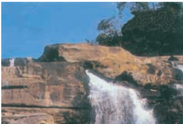
चित्र 2.8 : प्रायद्वीपीय पठार

प्रायद्वीपीय पठार एक मेज की आकृति वाला स्थल है जो पुराने क्रिस्टलीय, आग्नेय तथा रूपांतरित शैलों से बना है। यह गोंडवाना भूमि के टूटने एवं अपवाह के कारण बना था तथा यही कारण है कि यह प्राचीनतम भूभाग का एक हिस्सा है। इस पठारी भाग में चौड़ी तथा छिछली घाटियाँ