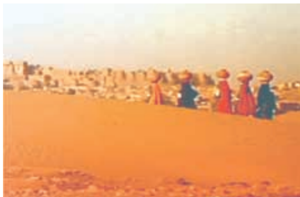
चित्र 2.9 : भारतीय मरुस्थल

बरकान (अर्धचंद्राकार बालू का टीला) का विस्तार बहुत अधिक क्षेत्र पर होता है, लेकिन लंबवत् टीले भारत-पाकिस्तान सीमा के समीप प्रमुखता से पाए जाते