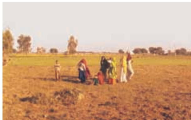
चित्र 2.7 : उत्तरी मैदान

उत्तरी मैदान तीन प्रमुख नदी प्रणालियों- सिंधु, गंगा एवं ब्रह्मपुत्र तथा इनकी सहायक नदियों से बना है। यह मैदान जलोढ़ मृदा से बना है। लाखों वर्षों में हिमालय के गिरिपाद में स्थित बहुत बड़े बेसिन (द्रोणी) में जलोढ़ों का निक्षेप हुआ, जिससे इस उपजाऊ मैदान का निर्माण हुआ है। इसका विस्तार 7 लाख वर्ग कि॰मी॰ के क्षेत्र पर है। यह मैदान लगभग 2,400 कि॰मी॰ लंबा एवं 240 से