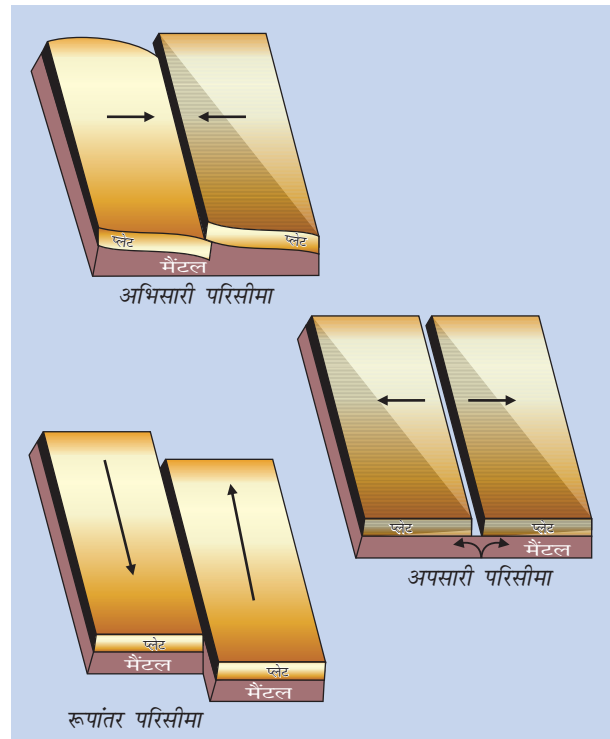
चित्र 2.1: प्लेटों की विभिन्न गतियाँ

प्लेटों की गति के कारण प्लेटों के अंदर एवं ऊपर की ओर स्थित महाद्वीपीय शैलों में दबाव उत्पन्न होता है। इसके परिणामस्वरूप वलन, भ्रंशीकरण तथा ज्वालामुखीय क्रियाएँ होती हैं। सामान्य तौर पर इन प्लेटों की गतियों को