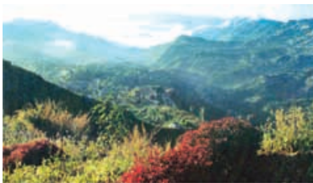
चित्र 2.6 : मिजो पहाड़ियाँ

ब्रह्मपुत्र हिमालय की सबसे पूर्वी सीमा बनाती है। दिहांग महाखड्ड (गार्ज) के बाद हिमालय दक्षिण की ओर एक तीखा मोड़ बनाते हुए भारत की पूर्वी सीमा के साथ फैल जाता है। इन्हें पूर्वांचल या पूर्वी पहाड़ियों तथा पर्वत शृंखलाओं के नाम से जाना जाता है। ये पहाड़ियाँ उत्तर-पूर्वी राज्यों से होकर गुजरती हैं तथा मजबूत बलुआ पत्थरों, जो अवसादी शैल है, से बनी है। ये घने जंगलों से ढँकी हैं तथा अधिकतर समानांतर शृंखलाओं एवं घाटियों के रूप में फैली हैं। पूर्वांचल में पटकाई, नागा, मिजो तथा मणिपुर पहाड़ियाँ शामिल हैं।