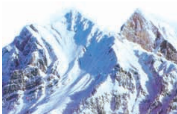
चित्र 2.5 : हिमालय पर्वत

हिमाद्रि के दक्षिण में स्थित शृंखला सबसे अधिक असम है एवं हिमाचल या निम्न हिमालय के नाम से जानी जाती है। इन शृंखलाओं का निर्माण मुख्यतः अत्याधिक संपीडित तथा परिवर्तित शैलों से हुआ है। इनकी ऊँचाई 3,700 मीटर से 4,500 मीटर के बीच तथा औसत चौड़ाई 50 किलोमीटर है। जबकि पीर पंजाल शृंखला सबसे लंबी तथा सबसे महत्वपूर्ण शृंखला है, धौलाधर एवं महाभारत शृंखलाएँ भी महत्वपूर्ण हैं। इसी शृंखला में कश्मीर की घाटी तथा हिमाचल के कांगड़ा एवं कुल्लू की घाटियाँ स्थित हैं। इस क्षेत्र को पहाड़ी नगरों के लिए जाना जाता है।