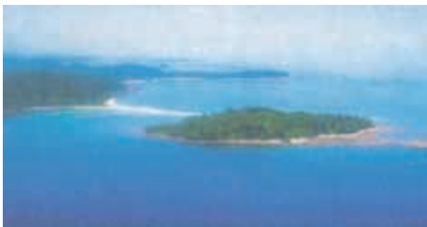
चित्र 2.11 : एक द्वीप

आप पहले ही देख चुके हैं कि भारत का मुख्य स्थल भाग अत्यधिक विशाल है। इसके अतिरिक्त भारत में दो द्वीपों का समूह भी स्थित है। क्या आप इन द्वीप समूहों को पहचान सकते हैं?