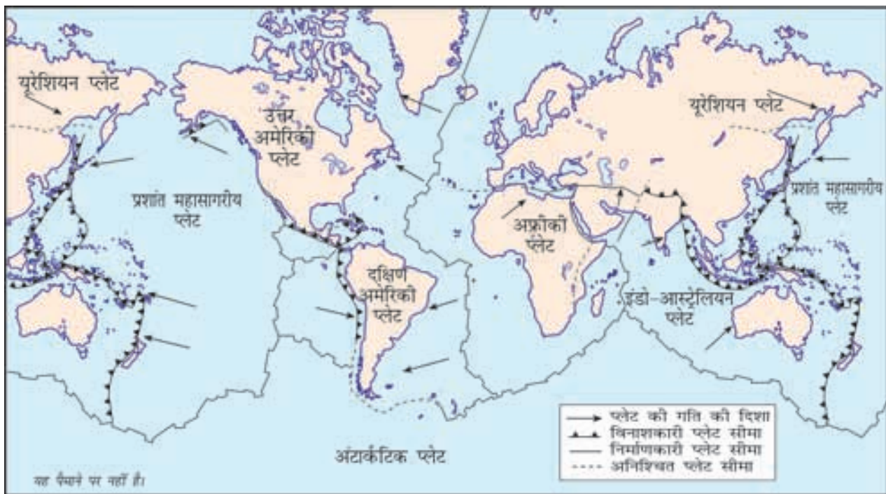
चित्र 2.2 : भू-पृष्ठ की मुख्य प्लेटें

तीन वर्गों में विभाजित किया गया है (चित्र 2.1)। कुछ प्लेटें एक-दूसरे के करीब आती हैं और अभिसारित परिसीमा का निर्माण करती हैं। जबकि कुछ प्लेट एक दूसरे से दूर जाती हैं और अपसारित परिसीमा का निर्माण करती हैं। जब दो प्लेट एक-दूसरे के करीब आती हैं, तब या तो वे टकराकर टूट सकती हैं या एक प्लेट फिसल कर दूसरी प्लेट के नीचे जा सकती है। कभी-कभी वे एक-दूसरे के साथ क्षैतिज दिशा में भी गति कर सकती हैं और रूपांतर परिसीमा का निर्माण करती हैं। इन प्लेटों में लाखों वर्षों से हो रही गति के कारण महाद्वीपों की स्थिति तथा आकार में परिवर्तन आया है। भारत की वर्तमान स्थलाकृति का विकास भी इस प्रकार की गतियों से प्रभावित हुआ है।