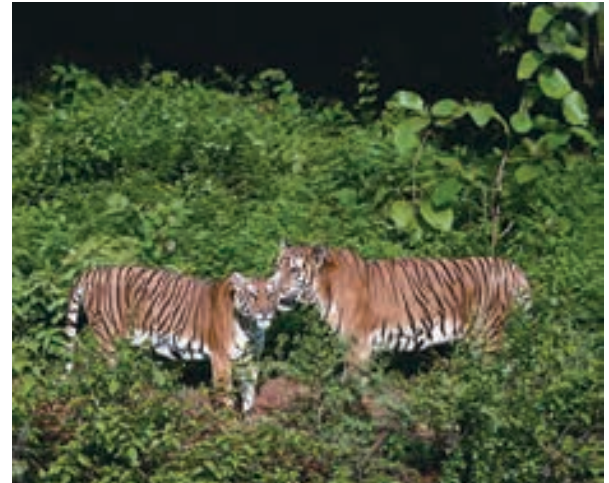
चित्र 1.3 भारत के विभिन्न चिड़ियाघरों में वन्य प्राणी