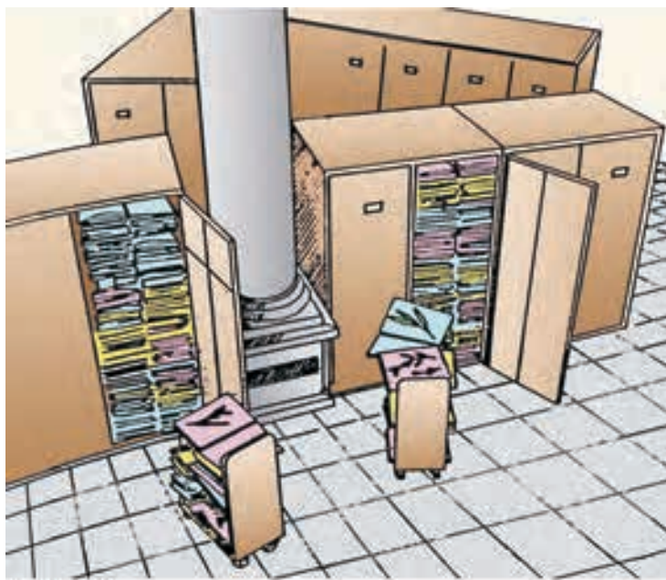
चित्र 1.2 वनस्पति संग्रहालय में पौधों के एकत्रित नमूने