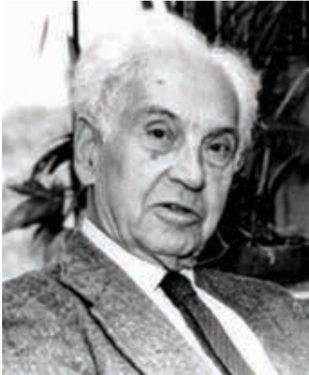
एरनस्ट मेयर (1904 - 2004)

एरनस्ट मेयर का जन्म 5 जुलाई, 1904 में कैंपटन, जर्मनी में हुआ था। आप हावर्ड विश्वविद्यालय के विकासपरक जीव वैज्ञानिक थे, जिन्हें '20वीं शती का डार्विन' कहा गया। आप अब तक के 100 महान वैज्ञानिकों में से एक थे। मेयर ने सन् 1953 में हावर्ड विश्वविद्यालय की कला एवं विज्ञान संकाय में नौकरी प्राप्त की और 1975 में एलेक्जेंडर अगासीज प्रोफेसर ऑफ जुलोजी एमीरिटस की पदवी के साथ अवकाश प्राप्त किया। अपने 80 सालों के कार्य जीवन में आपका पक्षी-विज्ञान, वर्गीकरण-विज्ञान, प्राणि-भूगोल, विकास, वर्गिकी तथा जीव विज्ञान के इतिहास एवं दर्शन आदि पर अनुसंधान केंद्रित रहा। आप ने लगभग अकेले ही विकासीय जीव विज्ञान के केंद्रीय प्रश्न जाति विविधता की उत्पत्ति को खड़ा किया, जो कि आज सच है। इसके साथ ही आपने हाल ही में स्वीकृत जीव वैज्ञानिक जाति वर्गिकी की परिभाषा की अगुवाई की। मेयर को तीन पुरस्कार दिए गए, जिन्हें व्यापक तौर पर जीव विज्ञान के तीन ताजों की संज्ञा दी जाती है: 1983 में बालजॉन प्राइज, 1998 में जीव विज्ञान के लिए इंटरनेशनल प्राइज और 1999 में क्राफ़र्ड प्राइज। मेयर ने 100 वर्ष की आयु में 2004 को स्वर्गवासी हुए।