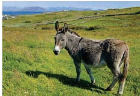
चित्र 9.2 खच्चर

के वांछनीय गुण सम्मिलित हो जाते हैं तथा इस संतति का पर्याप्त आर्थिक महत्व होता है; जैसे- खच्चर (चित्र 9.2)। क्या आप जानते हैं कि खच्चर की उत्पत्ति किस संकरण का परिणाम है?