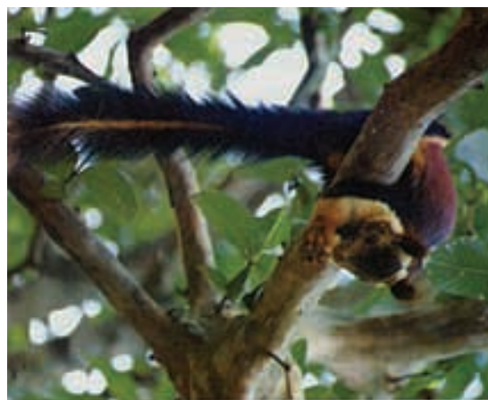
चित्र 7.3(b) : विशाल गिलहरी।