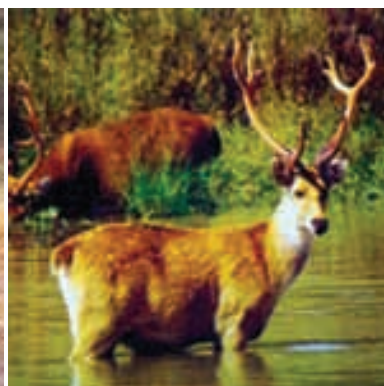
चित्र 7.6 : बारहसिंघा।