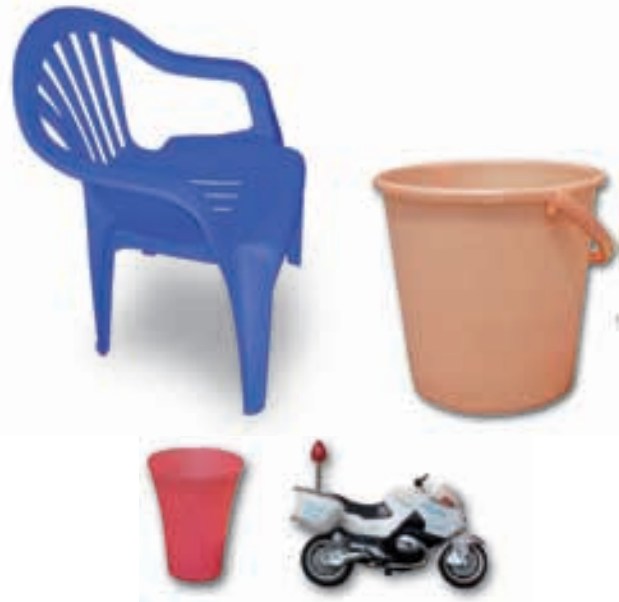
चित्र 3.7 : प्लास्टिक-निर्मित विभिन्न वस्तुएँ

प्लास्टिक की वस्तुएँ सभी सम्भव आकारों और साइजों में उपलब्ध हैं, जैसा आप चित्र 3.7 में देख सकते हैं। क्या आपको आश्चर्य नहीं होता कि यह कैसे संभव है? तथ्य यह है कि प्लास्टिक आसानी से साँचे में ढाला जा सकता है अर्थात् इसे कोई भी आकार दिया जा सकता है। प्लास्टिक का पुनः चक्रण हो सकता है, इसे पुनः प्रयुक्त किया जा सकता है, इसे रंगा और पिघलाया जा सकता है, इसे बेलकर चद्दरों में बदला जा सकता है अथवा इसकी तारें बनायी जा सकती हैं। इसलिए इनके इतने विभिन्न प्रकार के उपयोग हैं।