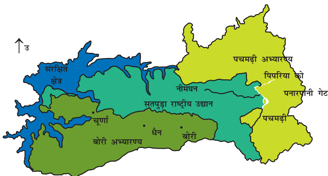
चित्र 7.1 : पचमढ़ी जैवमण्डल आरक्षित क्षेत्र।