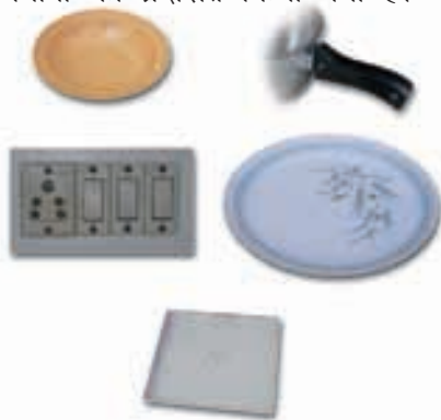
थर्मोसेटिंग प्लास्टिक से निर्मित वस्तुएँ

दूसरी ओर, कुछ प्लास्टिक ऐसे हैं जिन्हें एक बार साँचे में ढाल दिया जाता है तो इन्हें ऊष्मा देकर नर्म नहीं किया जा सकता। ये थर्मोसेटिंग प्लास्टिक कहलाते हैं। दो उदाहरण हैं - बैकेलाइट और मेलामाइन। बैकेलाइट ऊष्मा और विद्युत का कुचालक है। यह बिजली के स्विच, विभिन्न बर्तनों के हत्थे, आदि बनाने में काम आता है। मेलामाइन एक बहुउपयोगी पदार्थ है। यह आग का प्रतिरोधक है तथा अन्य प्लास्टिक की अपेक्षा ऊष्मा को सहने की अधिक क्षमता रखता है। यह फर्श की टाइलें, रसोई के बर्तन और कपड़े बनाने के उपयोग में लिया जाता है जो आग का प्रतिरोध करते हैं। चित्र 3.8 में थर्मोप्लास्टिक और थर्मोसेटिंग प्लास्टिक के विभिन्न उपयोगों को प्रदर्शित किया गया है।