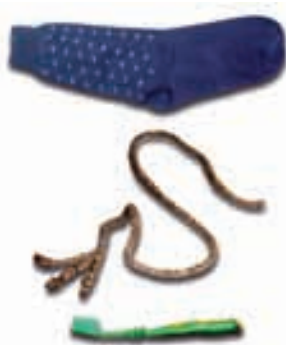
चित्र 3.3 : नाइलॉन से निर्मित विभिन्न वस्तुएँ।

हम नाइलॉन से निर्मित कई वस्तुओं को उपयोग में लाते हैं, जैसे— जुराबें, रस्से, तम्बू, दाँत साफ़ करने का ब्रुश, कारों की सीट के पट्टे, स्लीपिंग बैग (शयन थैला), परदे, आदि (चित्र 3.3)। नाइलॉन का उपयोग पैराशूट