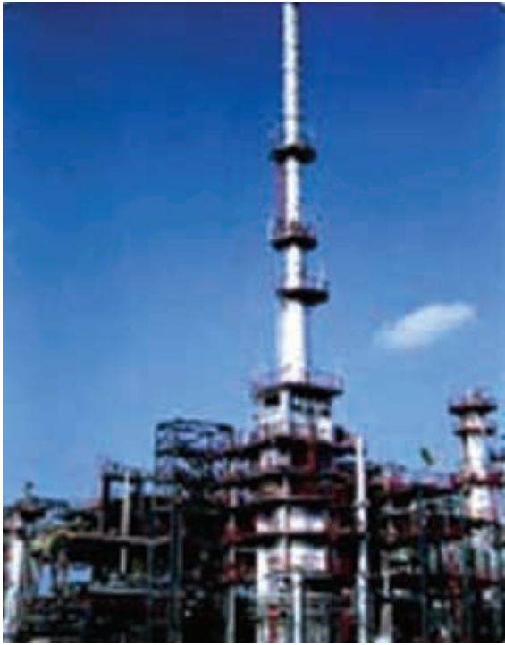
चित्र 5.5 : पेट्रोलियम परिष्करण।

को पृथक करने का प्रक्रम परिष्करण कहलाता है। यह कार्य पेट्रोलियम परिष्करण में सम्पादित किया जाता है (चित्र 5.5)।