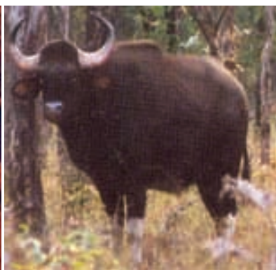
चित्र 7.5 : जंगली भैंसा।