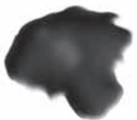
चित्र 5.3 : कोलतार।

यह एक अप्रिय गंध वाला काला गाढ़ा द्रव होता है (चित्र 5.3)। यह लगभग 200 पदार्थों का मिश्रण