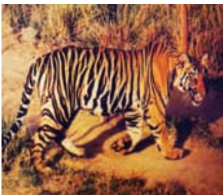
चित्र 7.4 : बाघ।