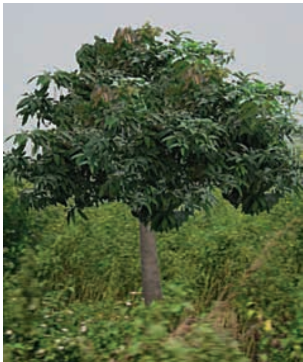
चित्र 7.3(a) : जंगली आम।