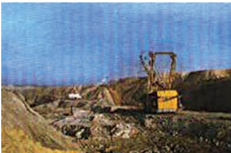
चित्र 5.2 : कोयले की एक खान।

वायु में गर्म करने पर कोयला जलता है और मुख्य रूप से कार्बन डाइऑक्साइड गैस उत्पन्न करता है।