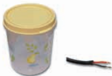
थर्मोप्लास्टिक से निर्मित वस्तुएँ