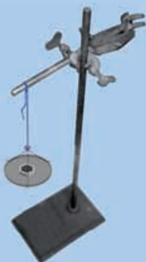
चित्र 3.5 : एक लोहे के स्टैंड पर क्लैम्प से लटकता हुआ एक धागा।

एक क्लैम्प युक्त लोहे का स्टैंड लीजिए। लगभग 60 सेमी लम्बा एक सूती धागा लीजिए। इसे क्लैम्प से बाँध दीजिए जिससे यह स्वतंत्र रूप से लटक जाए, जैसा चित्र 3.5 में प्रदर्शित है। मुक्त सिरे पर