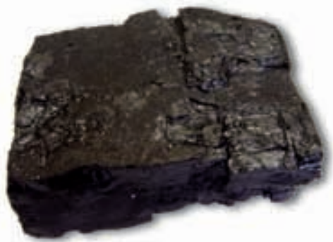
चित्र 5.1 : कोयला।

आपने कोयला देखा होगा या इसके बारे में सुना होगा (चित्र 5.1)। यह पत्थर जैसा कठोर और काले रंग का होता है।