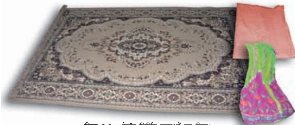
चित्र 3.2 : रेयॉन निर्मित वस्तुओं का चित्र।

आपने कक्षा VII में पढ़ा है कि रेशम कीट से प्राप्त किया जाता है। इसकी खोज चीन में हुई थी और इसे लम्बे समय तक कड़ी सुरक्षा में गोपनीय रखा गया। रेशम रेशे से प्राप्त कपड़ा बहुत मँहगा होता है परन्तु इसकी सुन्दर बुनावट (texture) ने प्रत्येक व्यक्ति को मोह लिया। रेशम को कृत्रिम रूप से बनाने के प्रयास किये गए। उन्नीसवीं शताब्दी के अन्तिम छोर पर वैज्ञानिकों को रेशम समान गुणों वाले रेशे प्राप्त करने में सफलता प्राप्त हुई। इस प्रकार का रेशा काष्ठ लुगदी के रासायनिक उपचार से प्राप्त किया गया। यह रेशा रेयॉन अथवा कृत्रिम रेशम कहलाया। यद्यपि रेयॉन प्राकृतिक स्रोत काष्ठ लुगदी से प्राप्त किया जाता है, यह एक मानव निर्मित रेशा है। यह रेशम से सस्ता होता है परन्तु इसे रेशम रेशों के समान बुना जा सकता है। इसे रंगों की कई किस्मों में रँगा जा सकता है। रेयॉन को कपास के साथ मिलाकर बिस्तर की चादरें बनाते हैं अथवा ऊन के साथ मिलाकर कालीन या गलीचा बनाते हैं। (चित्र 3.2)।