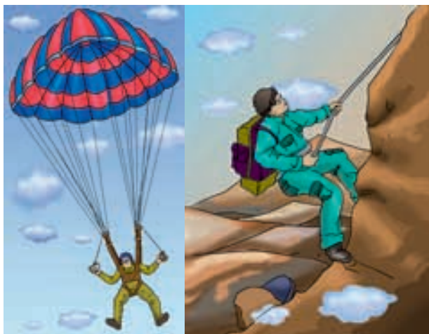
चित्र 3.4 : नाइलॉन रेशों के उपयोग।